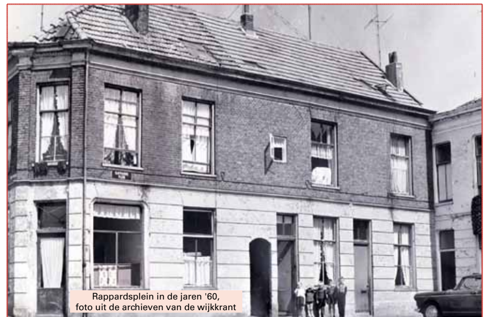
Rappardsplein in de jaren '60

Het is te koop bij de SWOA locatie in MFC De Wetering, Bonte Wetering 89 in Arnhem. De kosten zijn € 5,00