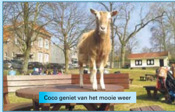
Coco geniet van het mooie weer

Vanaf Woensdag 2 april gaan we ook op woensdagmiddag. Elke woensdag is er een andere activiteit op De Leuke Linde. Bijvoorbeeld knuffelen met de dieren, een circusmiddag of een voetbalmiddag.