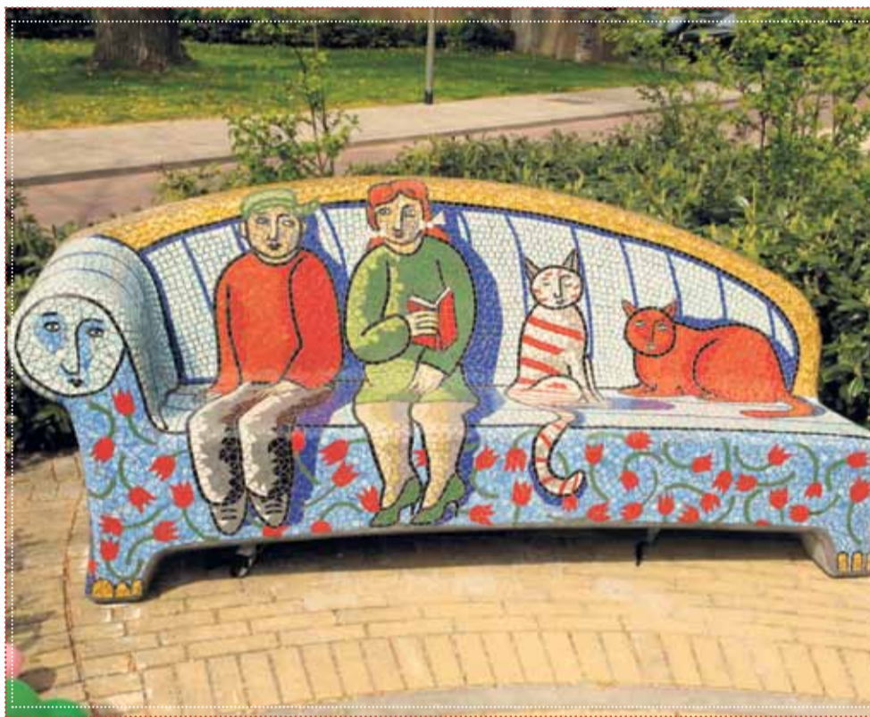
Social Sofa's bestaan al langer en zijn in het hele land te vinden, zelfs al op meerdere plekken in Arnhem. Deze Social Sofa staat echter in Tilburg en was het duizendste buurtproject van het land.