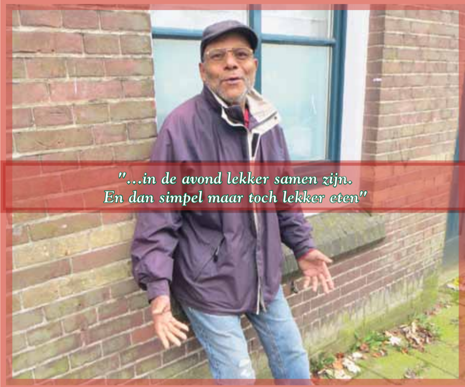
"...in de avond lekker samen zijn. En dan simpel maar toch lekker eten"

Meneer Koulen zit buiten zijn huis op de Agnietenstraat te wachten. Hij wordt opgehaald om te dialyseren. Heeft hij plannen voor kerstdagen? "Uhm..ja, ik denk dat ik bij de familie zit." En hoe ziet de invulling van die dagen eruit? "Vrij eenvoudig, niets bijzonders eigenlijk. In ieder geval in de avond lekker samen zijn. En dan simpel maar toch lekker eten. En elkaar een presentje gunnen, dat hoort er toch ook bij." Dan staat de taxibus voor. Snel maken we een foto.