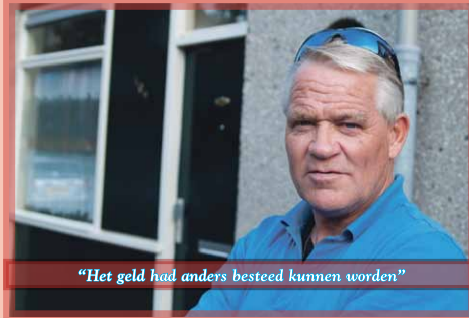
“Het geld had anders besteed kunnen worden”

“Het modekwartier is hartstikke mooi geworden alleen ik zie er nooit iemand. Elke dag kom ik er langs maar het is zo stil. Op z'n Klarendals gezegd, je ziet er nooit een kip. De winkels zijn ook bijna nooit open. Maar ja, modekwartier of niet, wat hebben wij, Klarendallers, er aan? Het is veels te duur. Dus ja, ik ben het wel eens. Het geld had anders besteed kunnen worden. Als ik een tip mag geven, investeer in groen.”