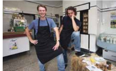
www.juniorfoodshowroom.nl of volg ze op Facebook.

binnen gehaald, opgeruimd. Ze verhuizen, gelukkig niet ver van Klarendal vandaan. Het is een klein stukje verder fietsen. In september verhuist Junior Foodshowroom naar Kweekland aan de Dalweg . Daar worden al lokale producten gekweekt. Junior gaat het Kweeklandteam en stichting Ortus vanaf begin oktober aanvullen met de kweek van groenten en met een winkel voor lokale boodschappen. En op de zaterdagen zijn de tafels ook gewoon weer gedekt voor Junior Aan Tafel.