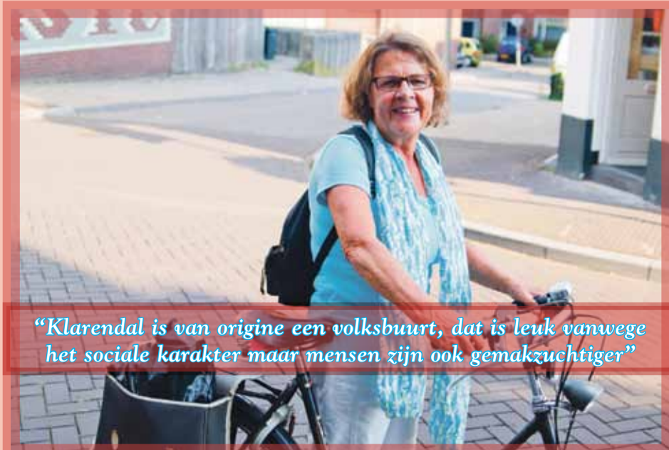
“Klarendal is van origine een volksbuurt, dat is leuk vanwege het sociale karakter maar mensen zijn ook gemakzuchtiger”

“Ik kom in Klarendal een keer per week, ik geef taallessen aan een meisje van zeven. Ik ken ook eigenlijk alleen deze straat, de Klarendalseweg. Het is een hele leuke straat zo met die winkeltjes. Zelf woon ik in de Hoogkamp, een totaal tegenovergestelde wijk waar veel kakkers wonen. Klarendal is van origine een volksbuurt, dat is leuk vanwege het sociale karakter maar mensen zijn ook gemakzuchtiger. Ik zie best veel afval op straat. Maar ik heb me nog geen moment onveilig gevoeld. Ik denk ook dat het een vooroordeel is dat mensen denken dat ze bang moeten zijn in wijk als deze.”