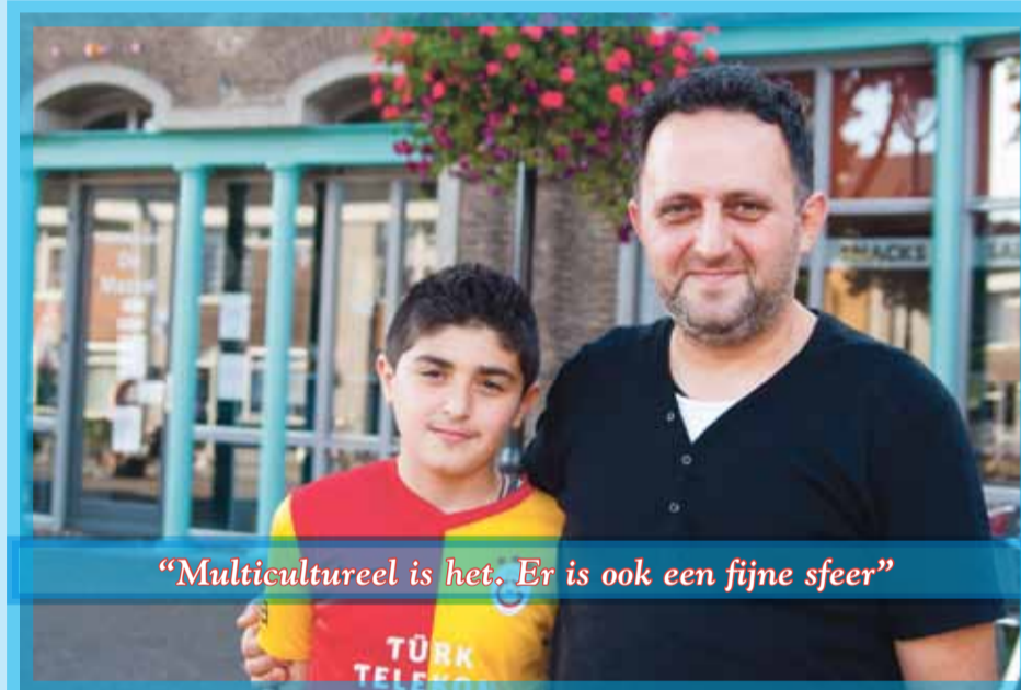
“Multicultureel is het. Er is ook een fijne sfeer”

“Oh nee, het is juist drukker geworden in de wijk. Echt heel erg gezellig. Met het modekwartier zijn er veel nieuwe winkels bij gekomen. En dus ook veel nieuwe mensen van verschillende culturen. Multicultureel is het. Er is ook een fijne sfeer. Ik kan ook altijd vrouwen op mijn burens. Ook qua uiterlijk is de wijk verbeterd. De weg bijvoorbeeld. Maar er zijn ook mooie lantaarns geplaatst. Het is in oude stijl aangepast. Heel erg leuk.” Zoon Altan “De ijswinkel is geopend en dat is goed.”