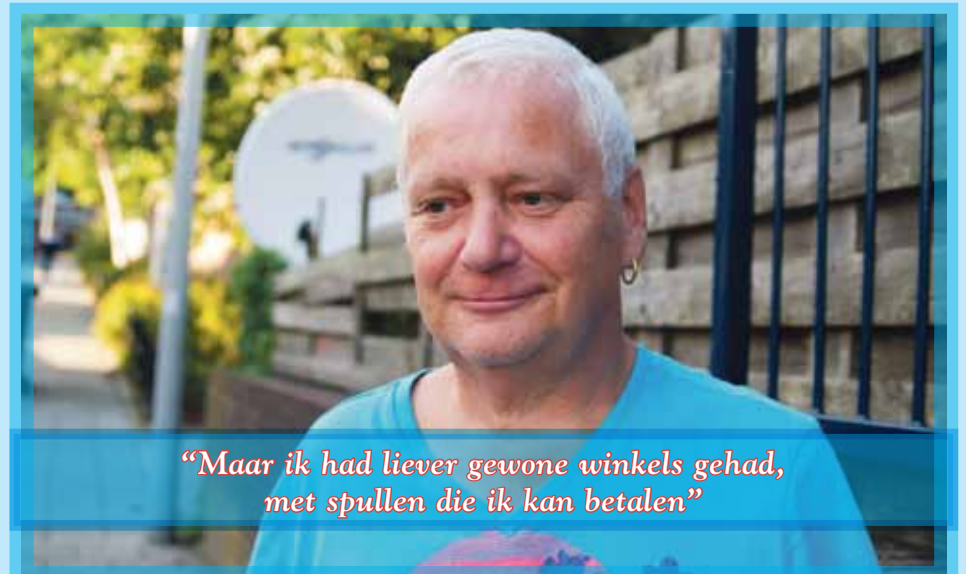
“Maar ik had liever gewone winkels gehad, met spullen die ik kan betalen”