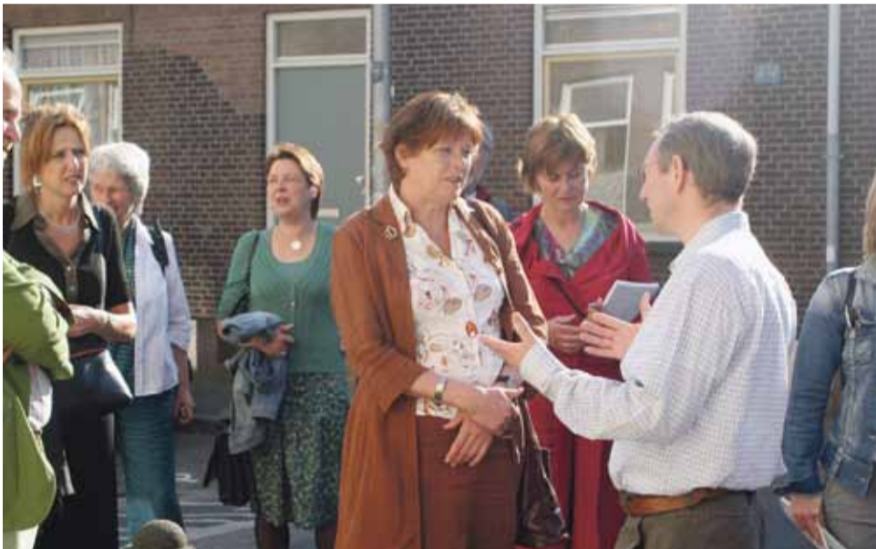
Minister Ella Vogelaar kwam in 2007 bij aanvang van het beleid kijken en luisteren naar bewoners, beroepskrachten en ondernemers.