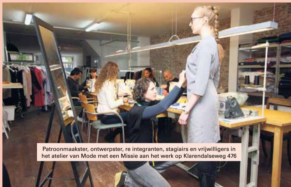
Patroonmaakster, ontwerpster, re-integranten, stagiairs en vrijwilligers in het atelier van Mode met een Missie aan het werk op Klarendalseweg 476