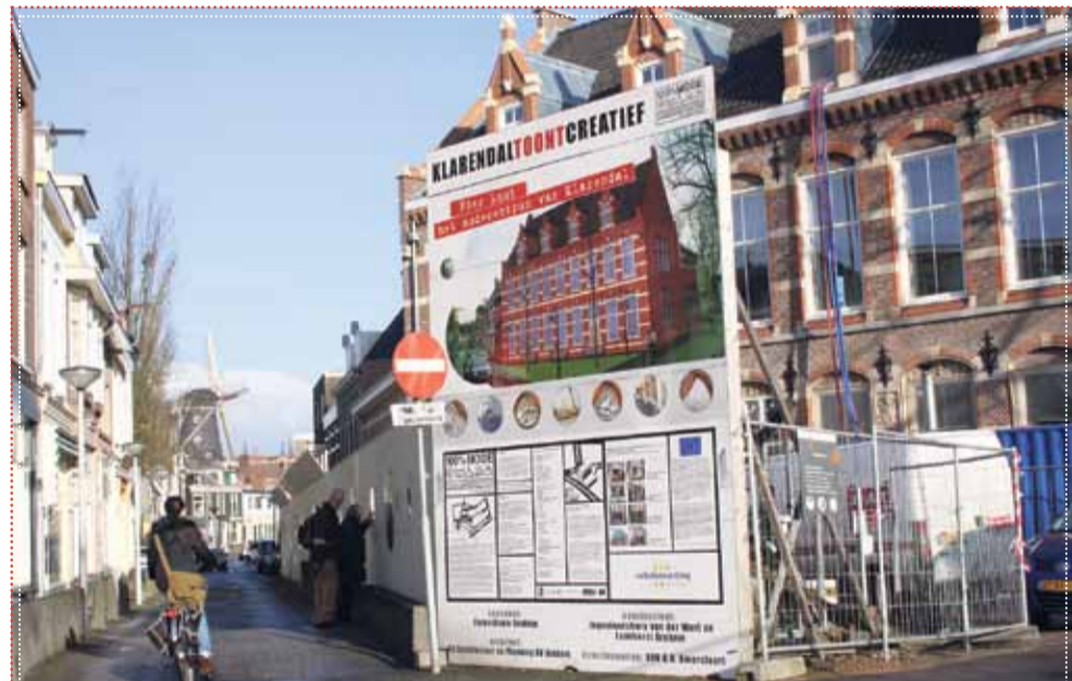
Eén van de opdrachten van Volkshuisvesting was het plaatsen van het oude postdistributiecentrum als nieuwe frisse entree naar de wijk. Bedacht in 2006, januari 2008 was het bijna klaar.

Een bijzondere bijkomstigheid is dat minister Blok (Wonen) vlak voor de zomer alarmerend in het nieuws kwam; "Blok wil dat corporaties zich voortaan alleen nog maar bezighouden met het huisvesten van mensen met een smalle beurs, in de eigen regio. Corporaties moeten zich ook minder bezighouden met het leefbaar maken van de wijk." Juist hij rijkt de prijs uit en des te leuker zou het zijn als Volkshuisvesting Arnhem met de trofee voor Klarendal naar huis komt!