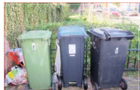
Drie containers én plastic afvalzakken; een Klarendals huishouden wat het binnen zijn territorium niet kwijt kan

En zo komen we bij de LEUKE LINDE . Vrijwilligers van de Leuke Linde halen namelijk al jaren het oud papier aan de straten op en krijgen per kilo een vergoeding die ten goede komt aan de bouwspiegelplaats. Reaguurders op Facebook dachten dat dit nu voorbij zou zijn. Maar nee, ze blijven oud papier op-